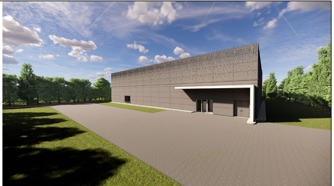
Kempen Krause Ingenieure GmbH, Aachen Eingangssituation