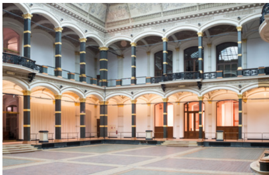
Gropius Bau Lichthof

Ausstellungsbesprechung mit Brinda Sommer